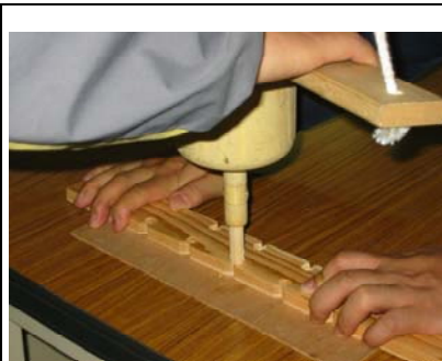
敷き板と火きり板しっかり押さえつける