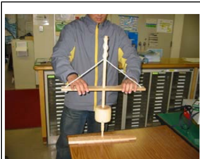
ひもを巻き付ける