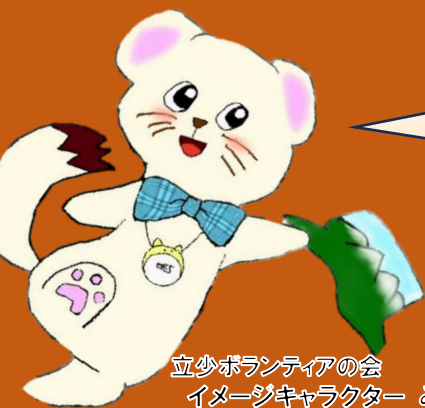
立少ボランティアの会 イメージキャラクター みーじよ