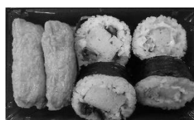
二種の太巻きと いなりの詰合せ