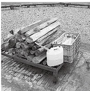
キャンプファイヤーセット(大)